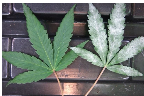
Hoja NO tratada con UV-C